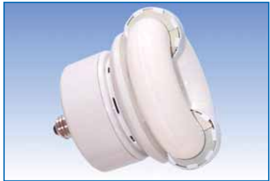
▲ Lampada a ballast incorporato

prodotto. Eventuali sperimentazioni, per di più fatte con i soldi pubblici, presterebbero il fianco a contumelie di carattere prettamente politico, con inevitabili ricadute sui vertici delle aziende e sui loro "sponsor";