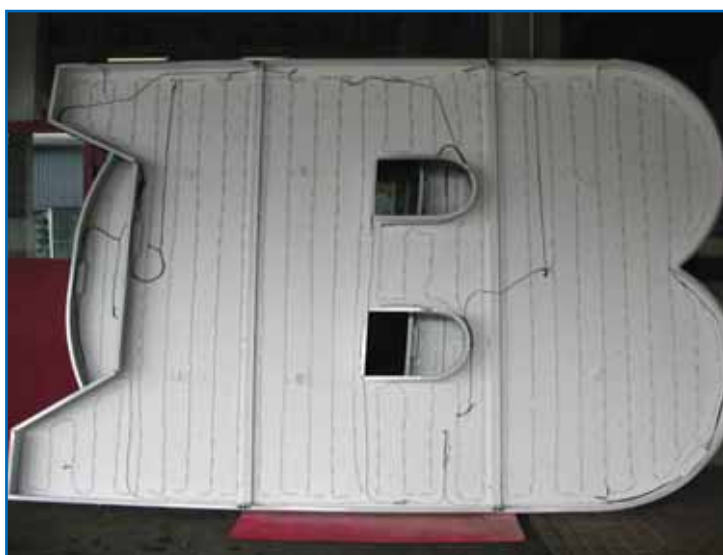
▲ Figura A: Grande lettera scatola: il capitolato del cliente prevedeva l'uso di diodi a LED in quanto accreditati di un minor consumo di energia elettrica in sede di esercizio, ignorando completamente le prestazioni fotometriche dell'insegna

La Classe 1 M comprende, invece, sorgenti di lunghezza d'onda compresa tra 302,5 nanometri e 4 micrometri, la cui emissione non sia dannosa se non si utilizzano strumenti ottici. In Classe 2 troviamo gli apparecchi che provocano una reazione della palpebra entro 0,25 secondi, mentre sono Classe 2 M se la reazione avviene previo l'utilizzo di strumenti ottici. Le classificazioni superiori (3R, 3B e 4) esulano da questa trattazione, in quanto in questo caso i diodi presentano emissioni pericolose per la pelle o per gli occhi e, pertanto, hanno impiego in