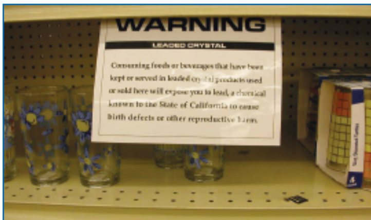
▲ Nei supermercati statunitensi spesso si mette in guardia il consumatore circa le possibili contaminazioni dovute al piombo contenuto nei bicchieri

Se si modifica la composizione chimica, si può produrre un'ampia gamma di vetri con differenti proprietà chimiche, fisiche e ottiche. Queste caratteristiche sono utili per diversi usi ed applicazioni; esamineremo, nel seguito, le principali